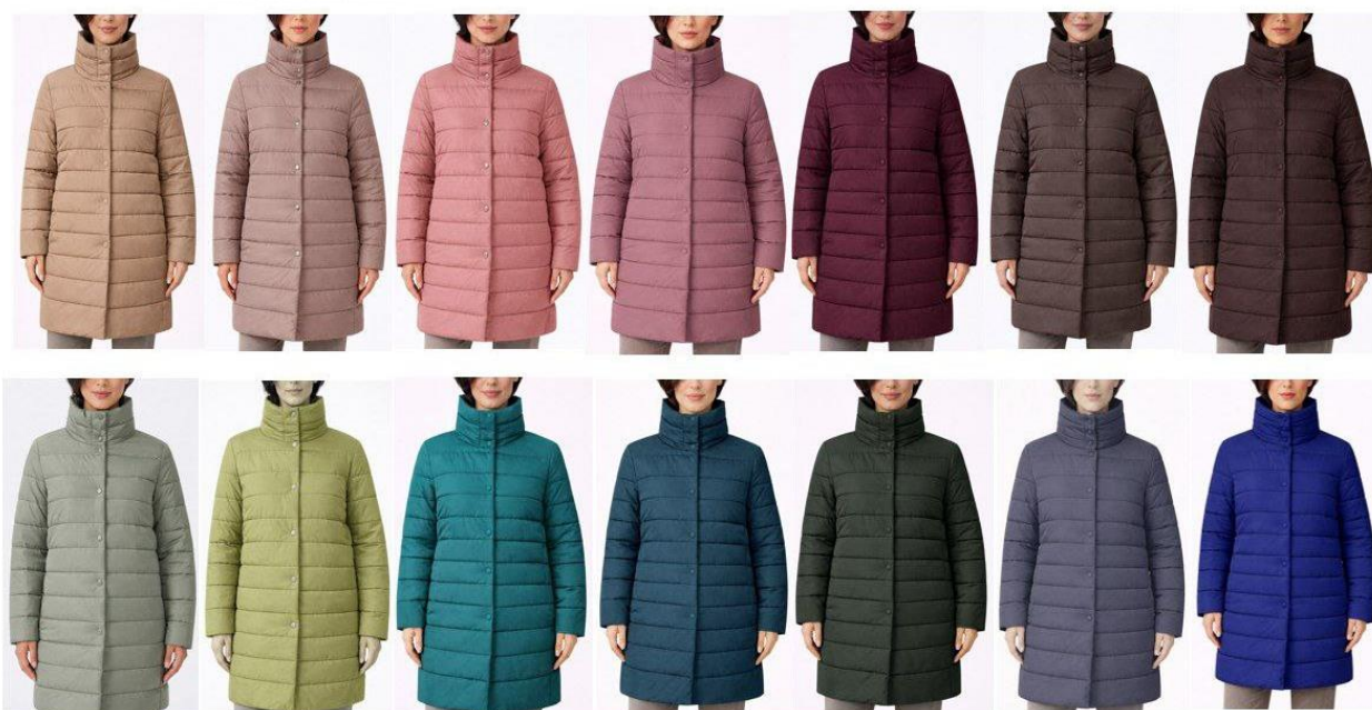
Рисунок 3- Пример выкрасов цветомоделей для нового сезона с помощью ИИ.

В рамках исследования была выполнена генерация цветовых решений коллекции, что позволило оценить возможности нейросетевых инструментов в разработке вариативности цветомоделей (рисунок 3).