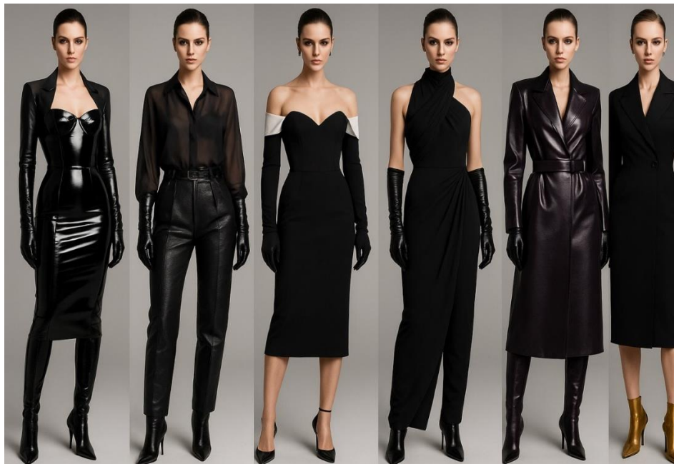
Рисунок 1- Изображения моделей одежды на основе текстового описания.

выявления особенностей интерпретации нейросетью формообразующих характеристик изделия (рисунок 1).