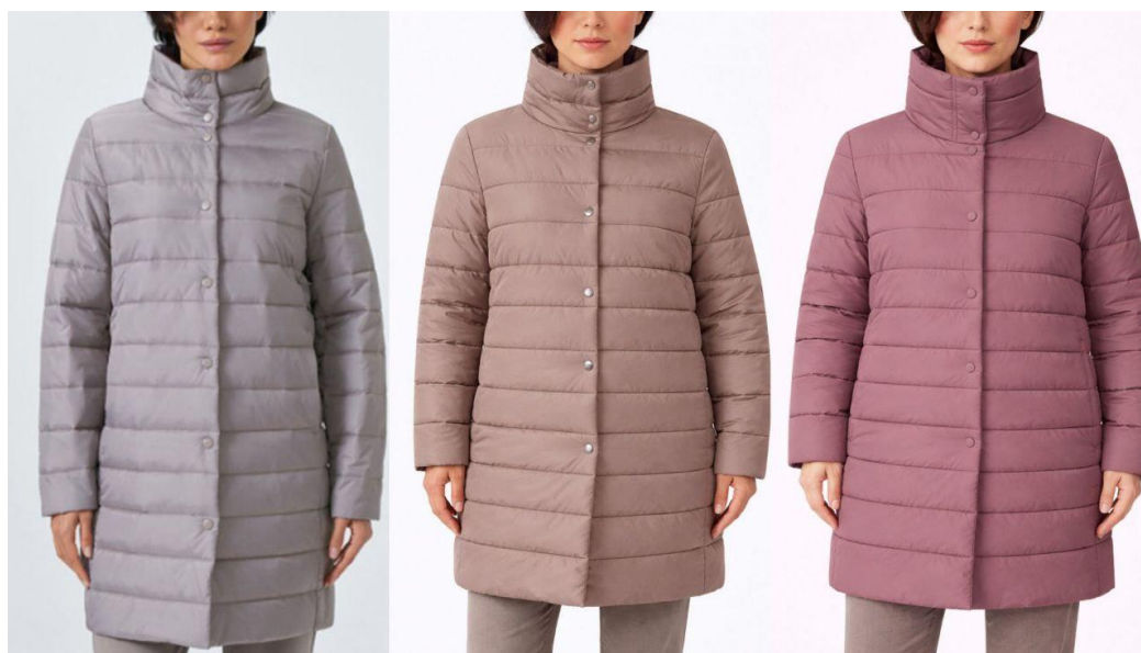
Рисунок 2- Изменения объема изделия из-за регенерации изображения.

В процессе анализа было выявлено, что изменение отдельных параметров запроса приводит к полной регенерации изображения, сопровождающейся изменением формы, объема и пластики изделия, что свидетельствует об отсутствии точечного редактирования (рисунок 2).