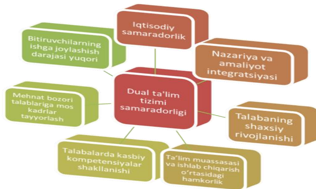
Rasm-2. Dual ta'lim tizimi samaradorligi

Hozirgi raqamli transformatsiya davrida ta'lim tizimida innovatsion texnologiyalardan samarali foydalanish jahon miqyosida ustuvor yo'nalishga aylanmoqda. Xususan, Janubiy Koreya va Yaponiya davlatlari raqamli ta'limni joriy etishda ilg'or tajribaga ega bo'lib, ushbu mamlakatlarda ta'lim jarayoni raqamlashtirish orqali sifat jihatdan yangi bosqichga ko'tarilgan.