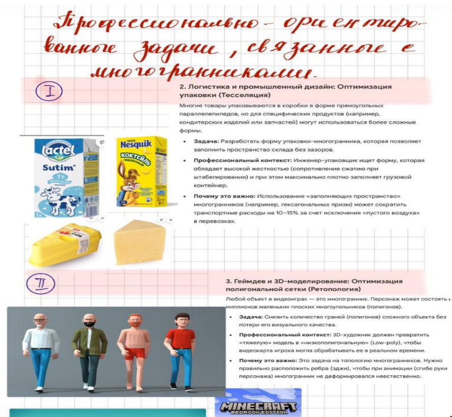
1-рисунок: Профессионально ориентированные задачи с помощью ИИ

учебных заведений, возможно и целесообразно использование современных инструментов искусственного интеллекта, таких как Gemini и Perplexity. Например: (Рис 1)